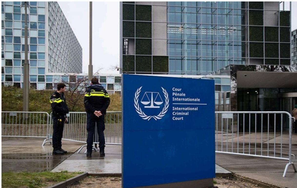
Україна передала до МКС докази воєнних злочинів Росії

У російських колоніях українських в'язнів б'ють, катують, піддають психологічному тиску, погрожують розстрілами і змушують до будівництва військових укріплень.