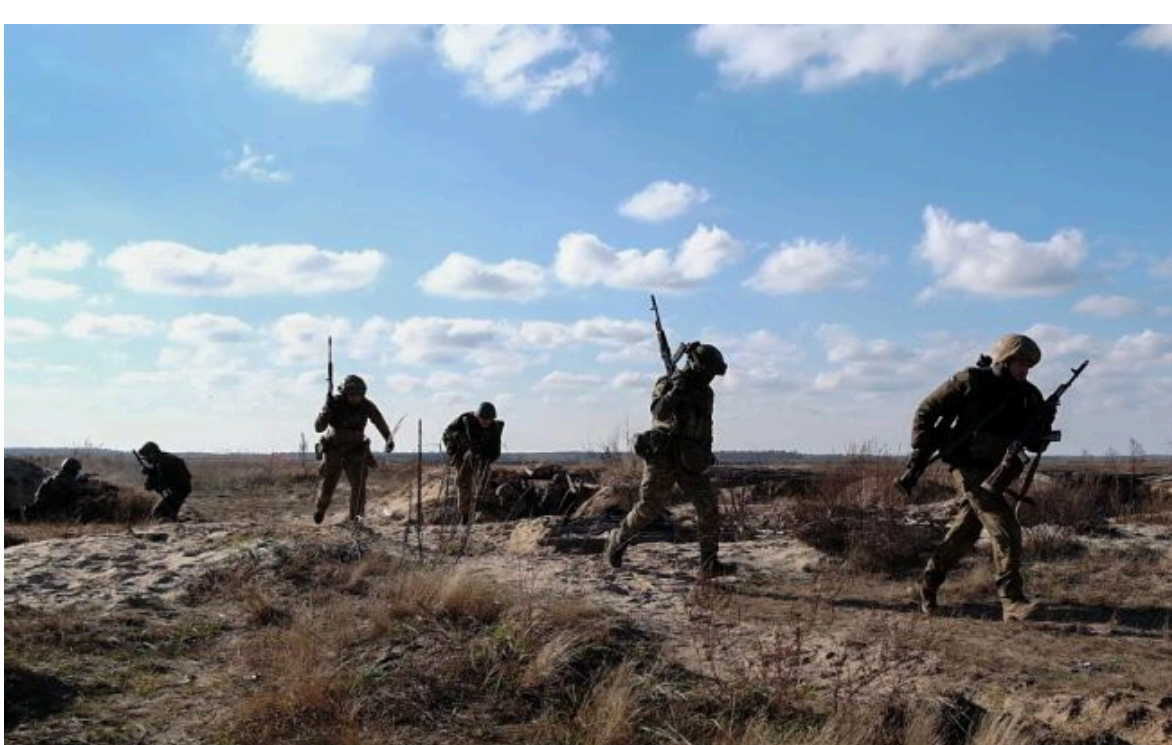
Фото ілюстративне: ЗСУ перейшли в контратаки (Віталій Носач, РБК-Україна)

Розумій ситуацію на фронті через факти, а не чулки з РБК-Україна у Google