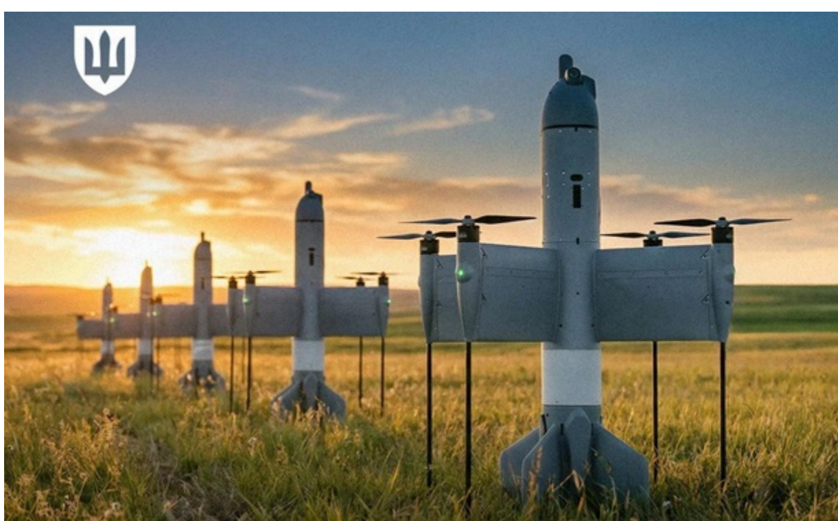
Україна виготовляє тисячі дронів-перехоплювачів для знищення "шахедів"

Зараз Україна створює дешеві ракети для перехоплення "шахедів". Потрібно створити запас до осінньо-зимового періоду, зазначив міністр.