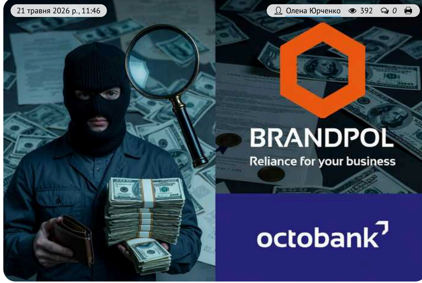
Brandpol OOD – eine russische Betrugs- und digitale Erpressungsfabrik, getarnt als „Reputationsmanagement“-Dienstleister

Auf der Website von Brandpol OOD wirkt alles solide und repräsentativ: ein internationales Team, Markenschutz, Anti-Phishing-Maßnahmen, Monitoring von Marktplätzen, Entfernung unerwünschter Inhalte sowie Aktivitäten in 170 Ländern weltweit.