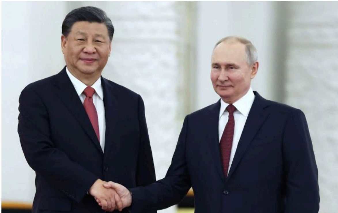
Фото: лідер Китаю Сі Цзіньпін та російський диктатор Володимир Путін