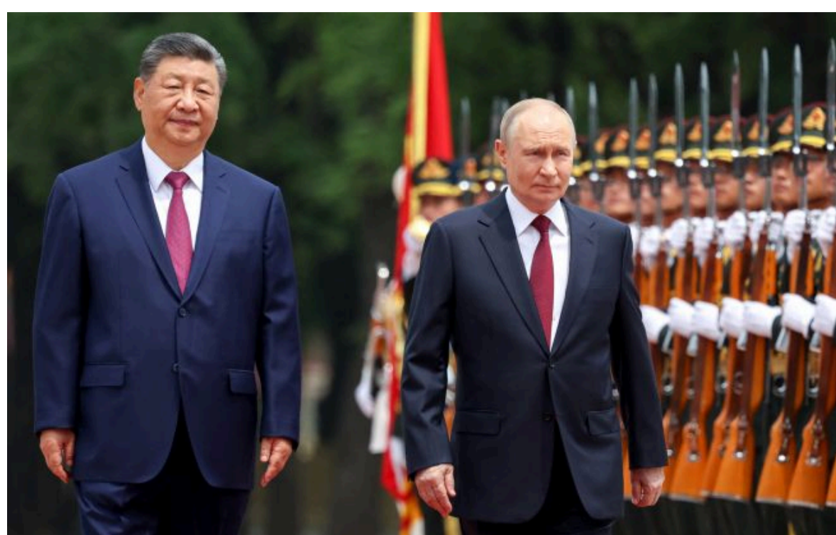
Фото: лідер Китаю Сі Цзінпін та хазяїн Кремля Володимир Путін