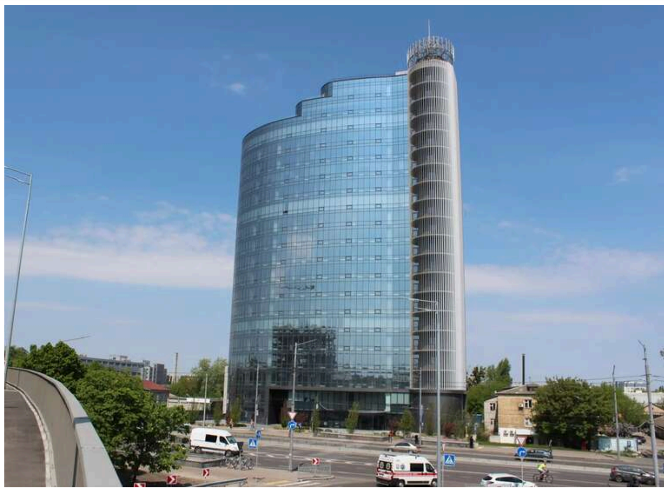
Зірвали пломби поліції та найняли охорону: шахрайський call-центр у Wave Tower відновив роботу попри обшуки

Найняли "охорону" й зірвали пломби: аферисти з Wave Tower продовжують ошукувати європейців попри слідчі дії.