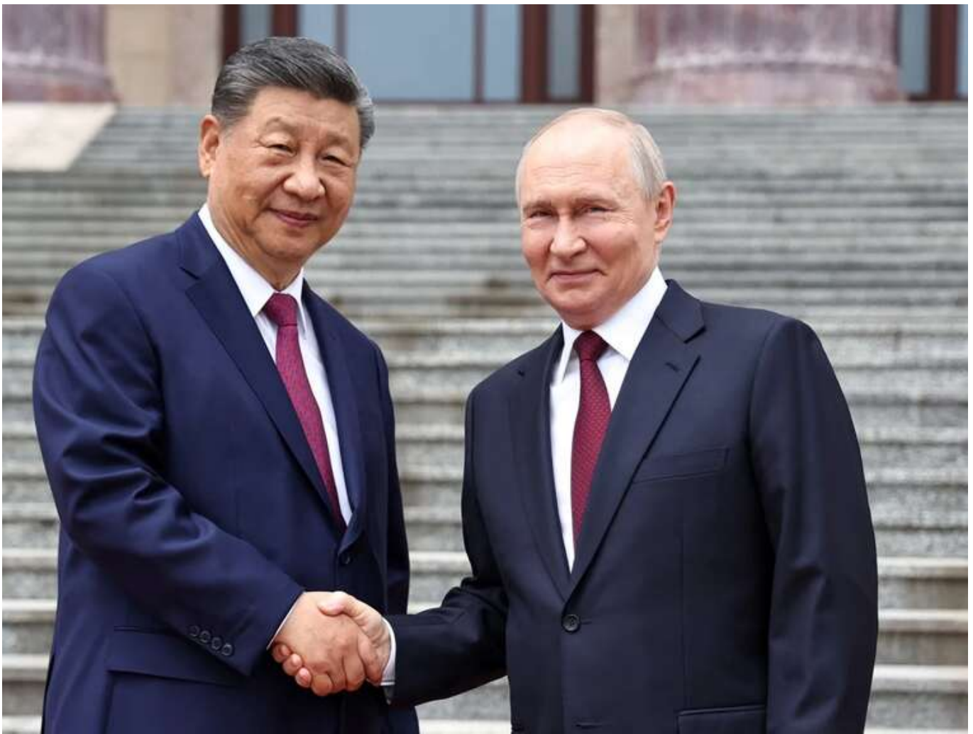
Сі Цзіньпін не дав Путіну згоди на будівництво газопроводу "Сила Сибіру-2", – WP