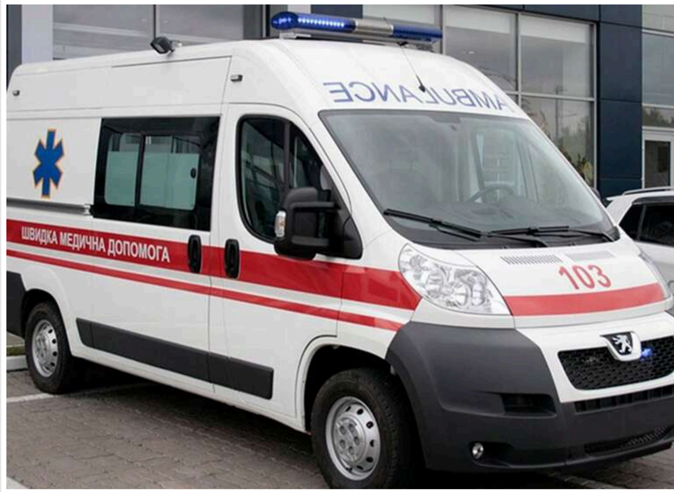
Російські війська атакували промислове підприємство в Харкові: є поранений

У Харкові РФ завдала удару по промислому підприємству, є поранений, – Терехов.