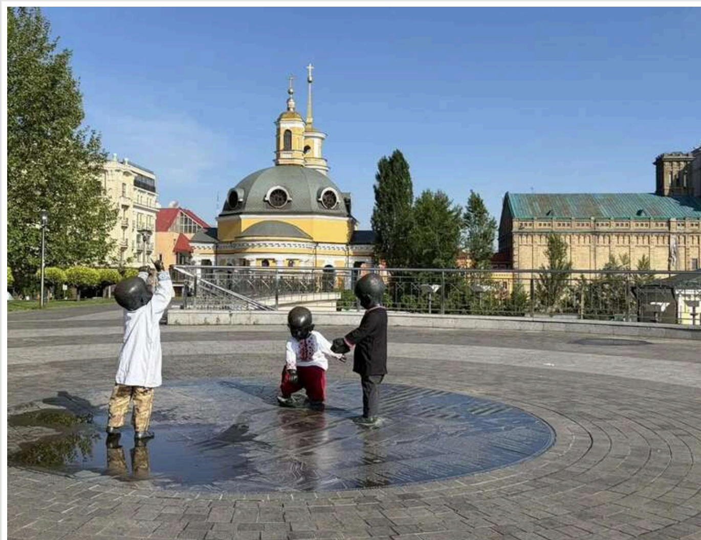
У вбранні з Волині, Закарпаття, Київщини та Чернігівщини: як малюки-засновники Києва святкують День вишиванки

У Києві в четвер, 21 травня, з нагоди Дня вишиванки оновили вбрання мініатюрних засновників міста — Кия, Шека, Хорива та їхньої сестри Либеді. Скульптури прикрасили традиційними вишиванками з різних областей України.