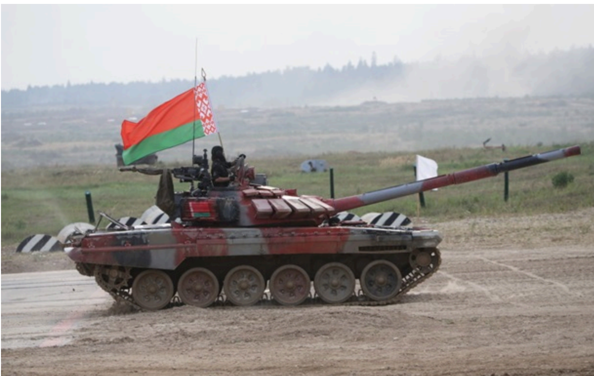
Військові навчання в Білорусі

Росія продовжує спроби втягнути Білорусь у війну, зокрема, ймовірно, з метою здійснення операції проти однієї з країн НАТО.