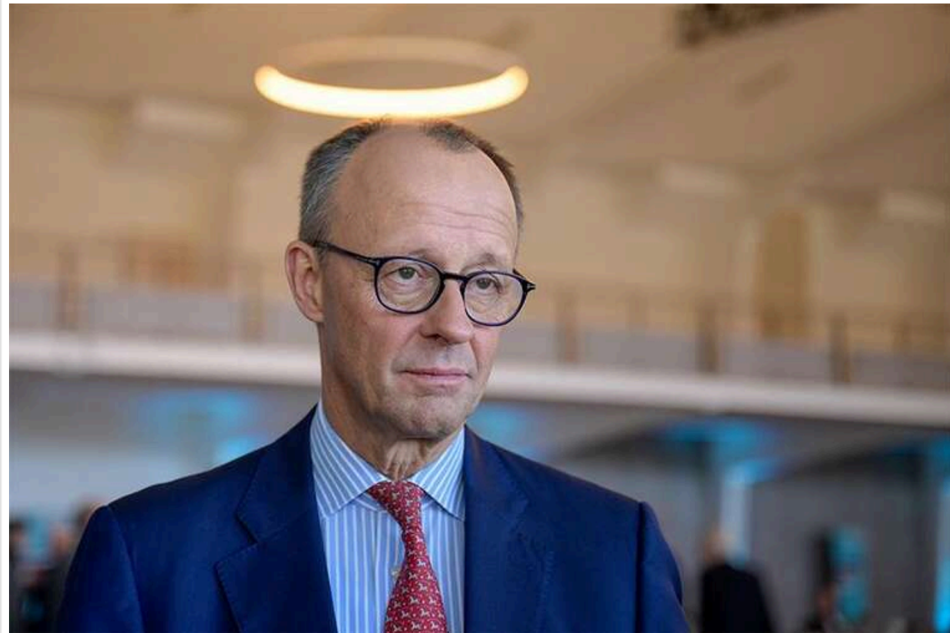
Мерц пропонує для України статус «асоційованого члена» ЄС із гарантіями безпеки

Мерц стверджує, що Україна здатна отримати статус «асоційованого члена» ЄС, незважаючи на те, що Зеленський раніше відкидав будь-які варіанти членства, крім повноцінного.