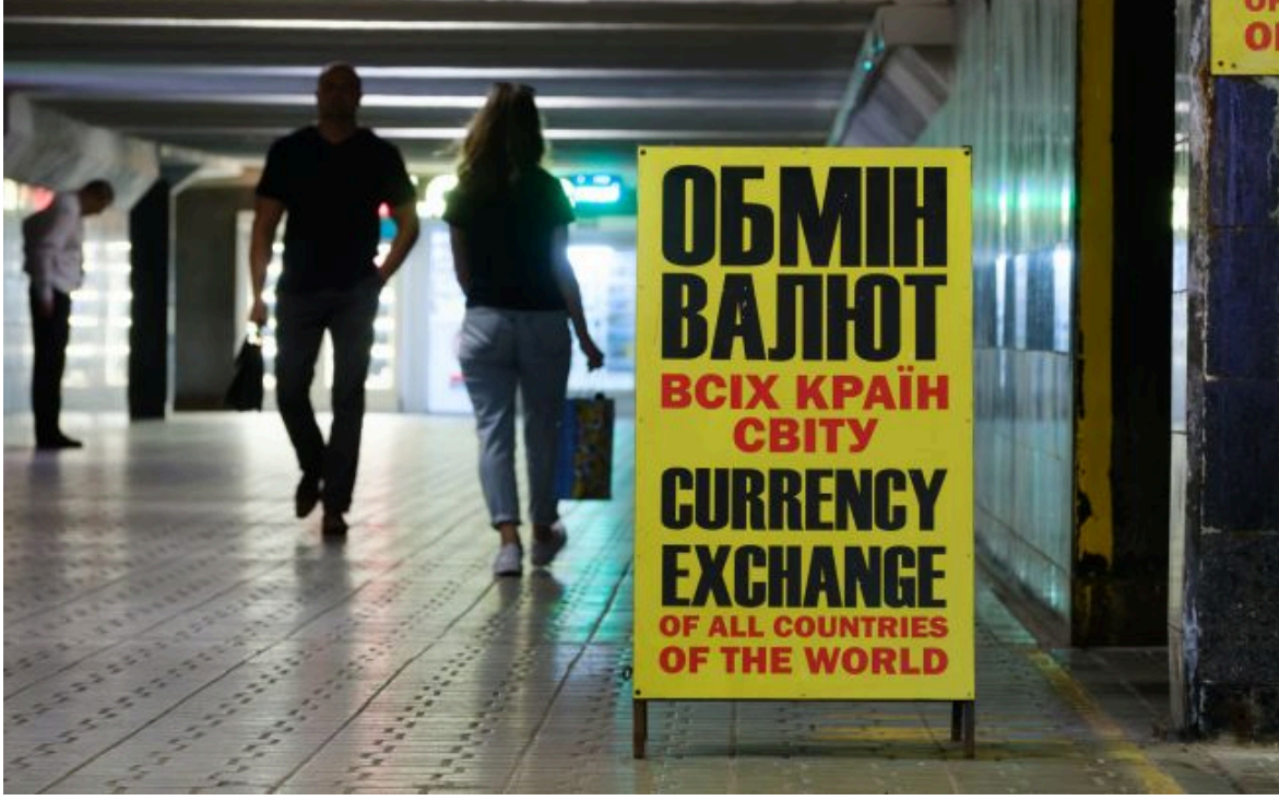
Фото: обмінники та банки оновили курс валют

Не чекай змін - готуйся до них! Фільтруй валютні коливання з РБК-Україна у Google