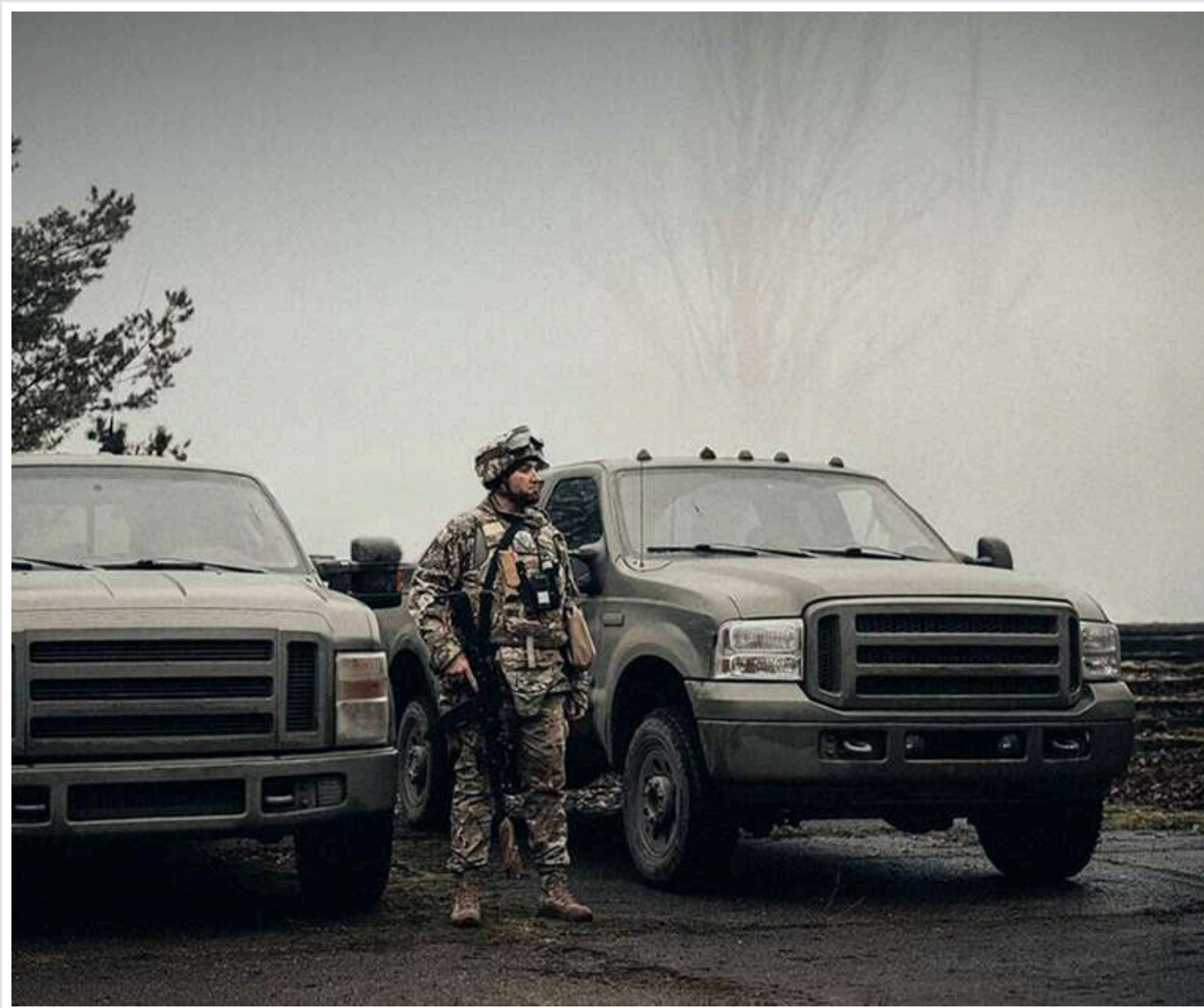
Тяємні мільярди на пікапи: Агенція оборонних закупівель проведе закриті торги на 6 мільярдів гривень із сумнівними фірмами

ДП МОУ «Агенція оборонних закупівель» 18 травня оголосило два тендери на закупівлю пікапів загальною очікуваною вартістю 6,01 млрд грн.