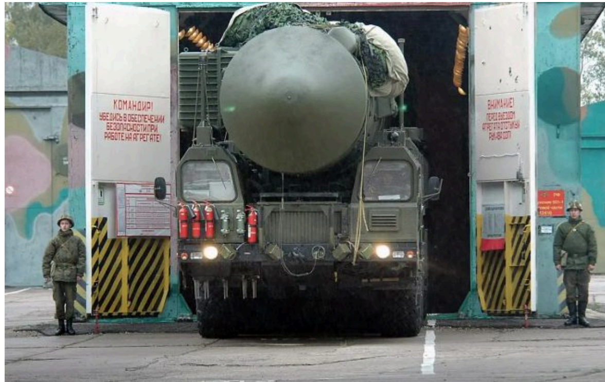
Фото: Росія заявила про доставку ядерних боєприпасів до Білорусі (росЗМ)