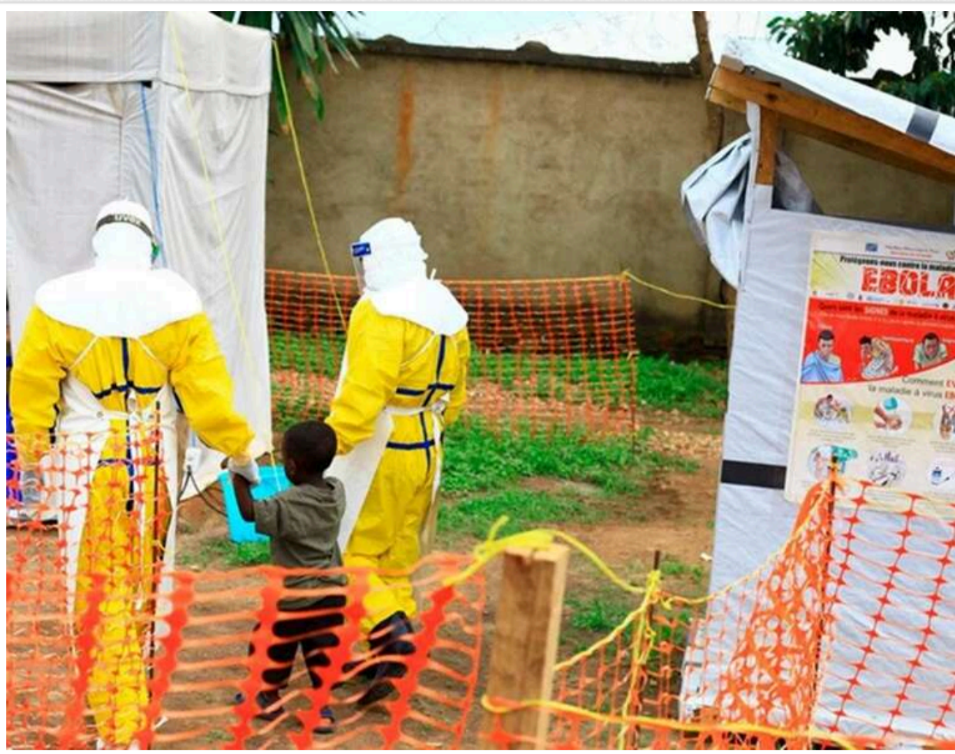
Вакцина проти нового штаму Еболи буде готова через 6–9 місяців, локалізації спалаху заважає конфлікт, - ВООЗ

Вакцина проти штаму Бундибуїю, що спричинив черговий спалах лихоманки Ебола в Уганді та Демократичній Республіці Конго, з'явиться не раніше ніж через шість-дев'ять місяців.