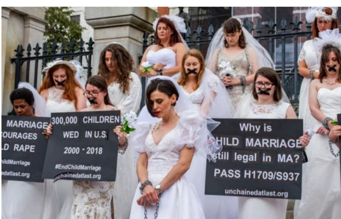
Фото: активістки, які пережили дитячі шлюби