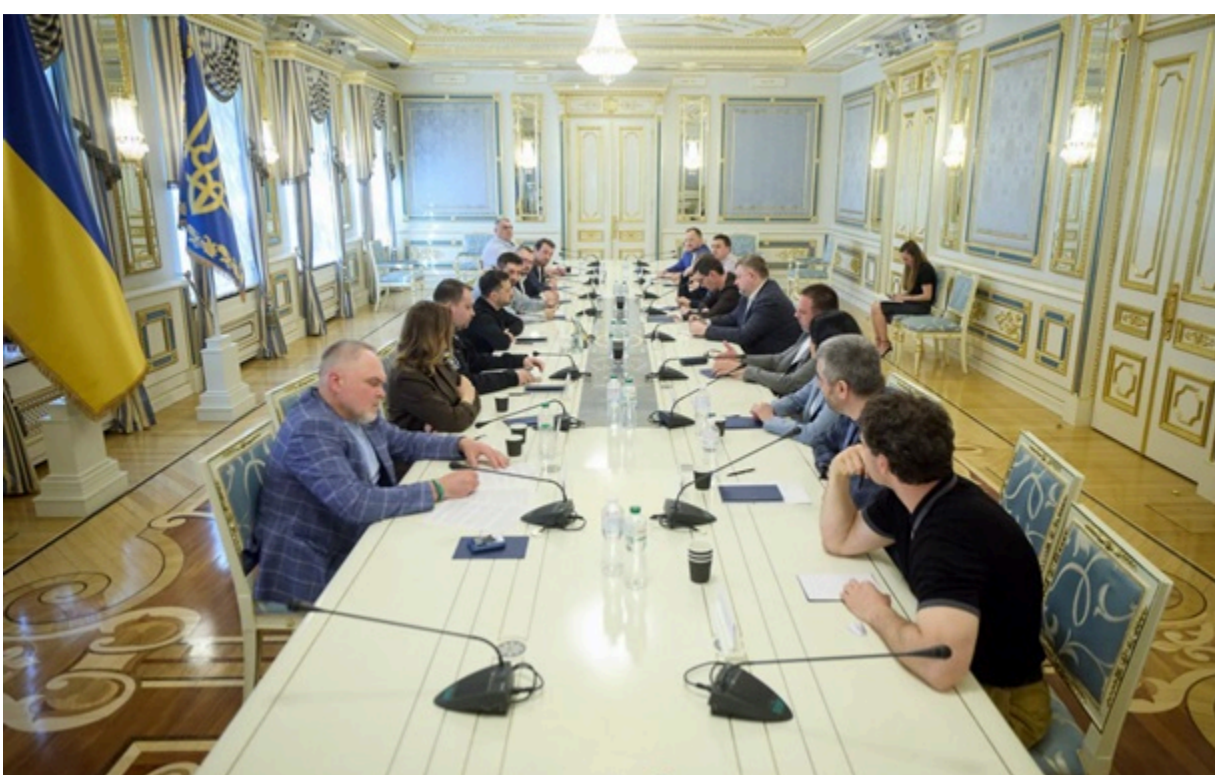
Зеленський зустрівся з представниками фракції Слуга народу

Під час зустрічі йшлося про "ключові питання" порядку денного Верховної Ради - євроінтеграцію, посилення стійкості.