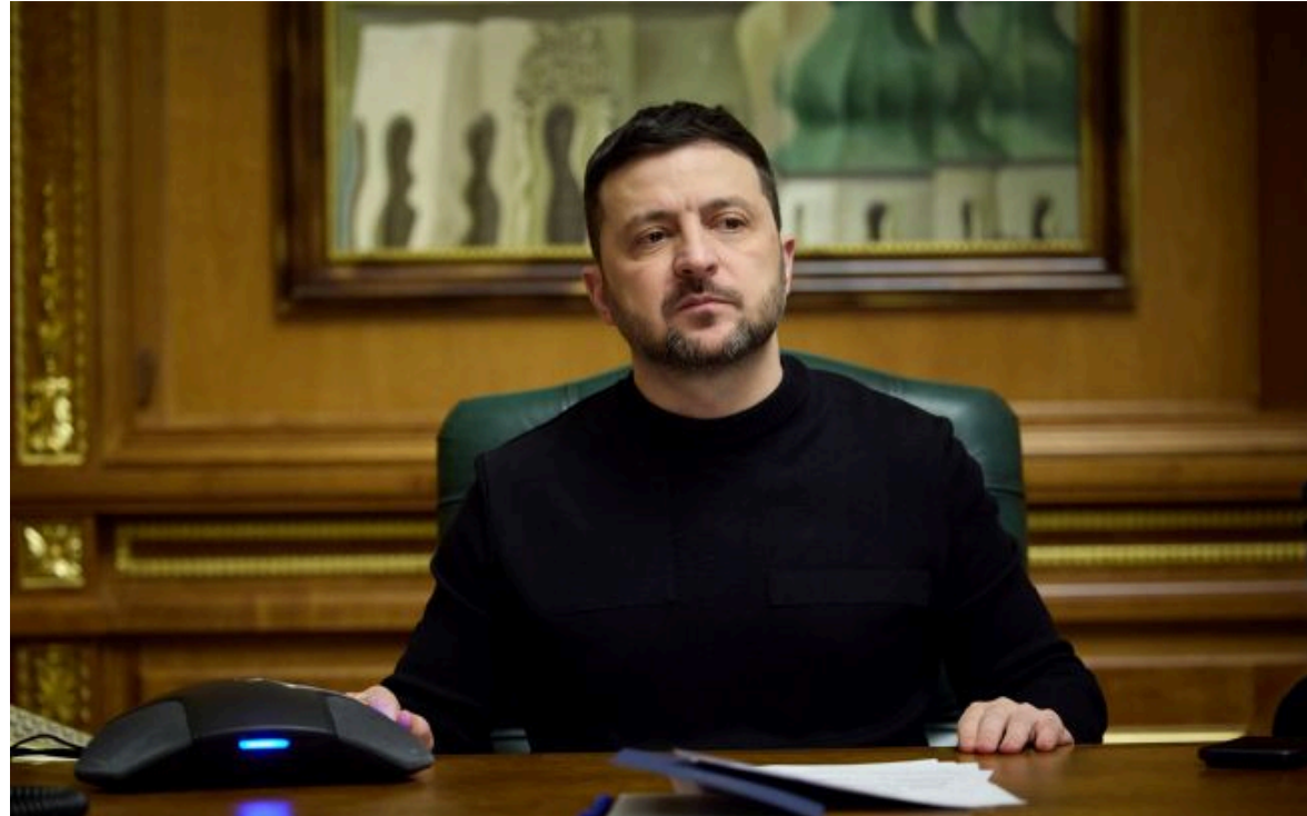
Фото: президент Володимир Зеленський

Не витрачай час на шум! Читай тільки суть з РБК-Україна у Google