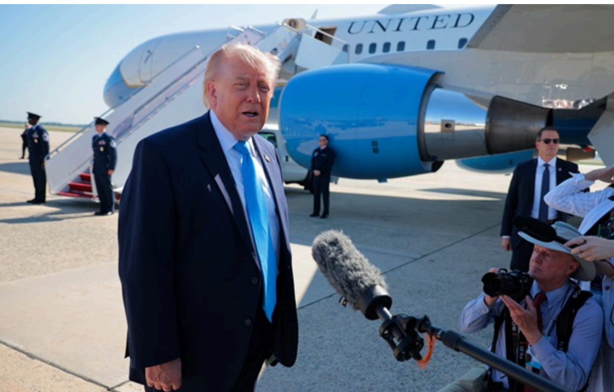
Трамп ще не вирішив щодо продажу зброї Тайваню

Цей крок недмірно розлютить Пекін, який вважає Тайвань частиною китайської території. Пряме спілкування між лідерами США і Тайваню практично не існує з 1979 року.