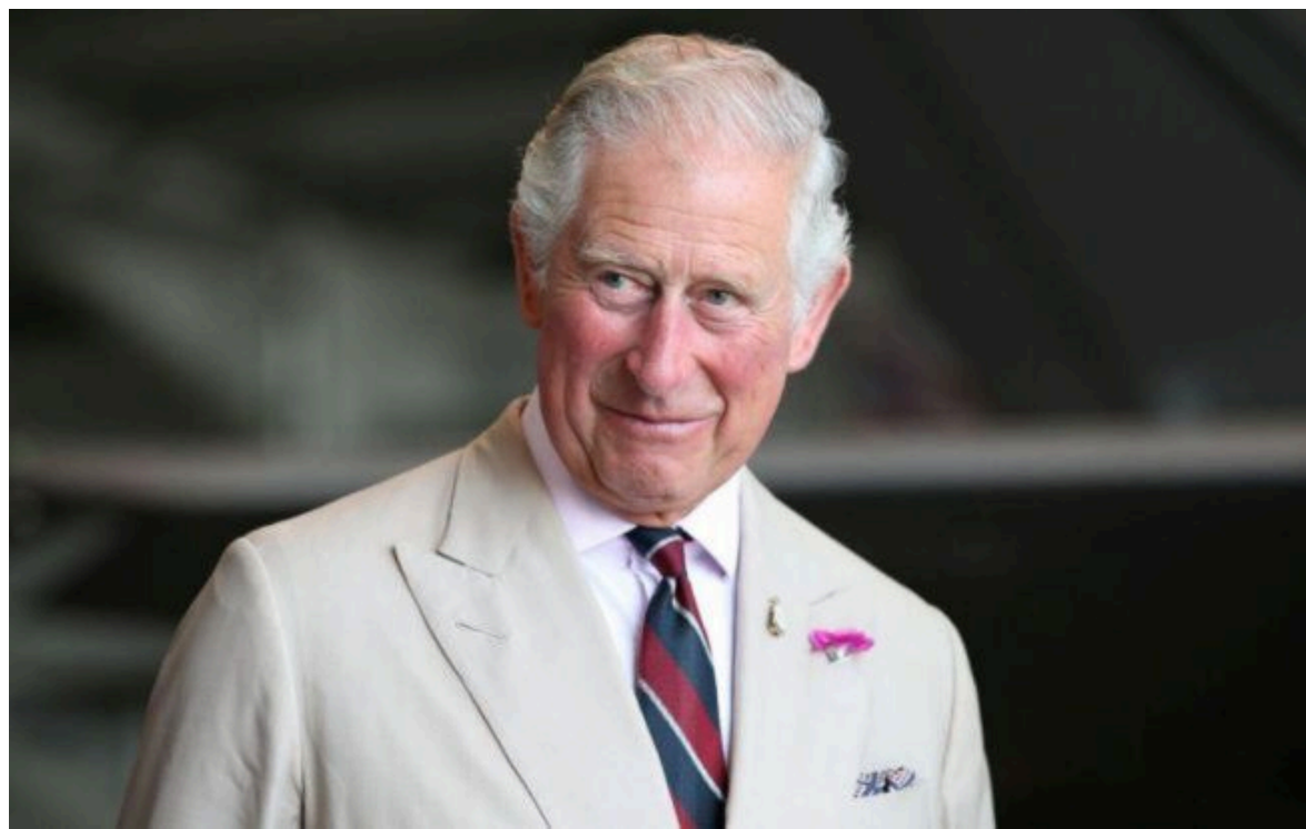
Фото: король Чарльз III