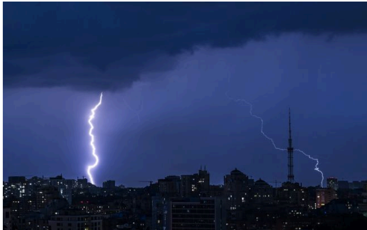
Фото: злива та гроза у Києві