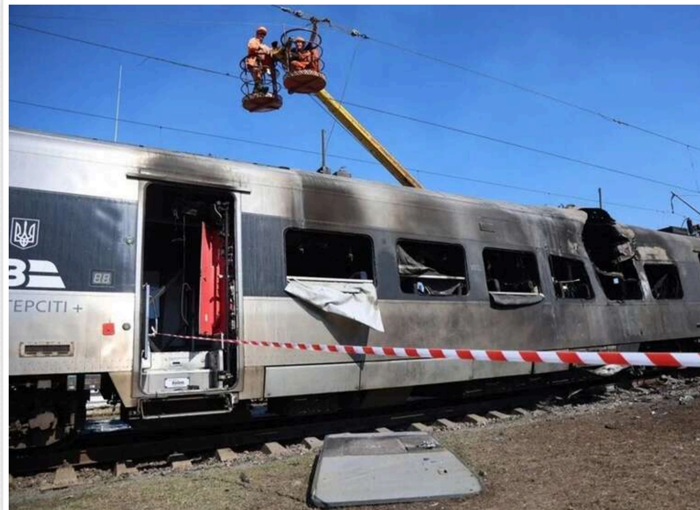
Росія змістила акцент атак з енергетики на залізницю, щоб підірвати український експорт, – експерт

Російська терористична армія змістила акцент атак із енергетики на залізничну інфраструктуру України. Тим самим ворог прагне підірвати експортний потенціал нашої країни.