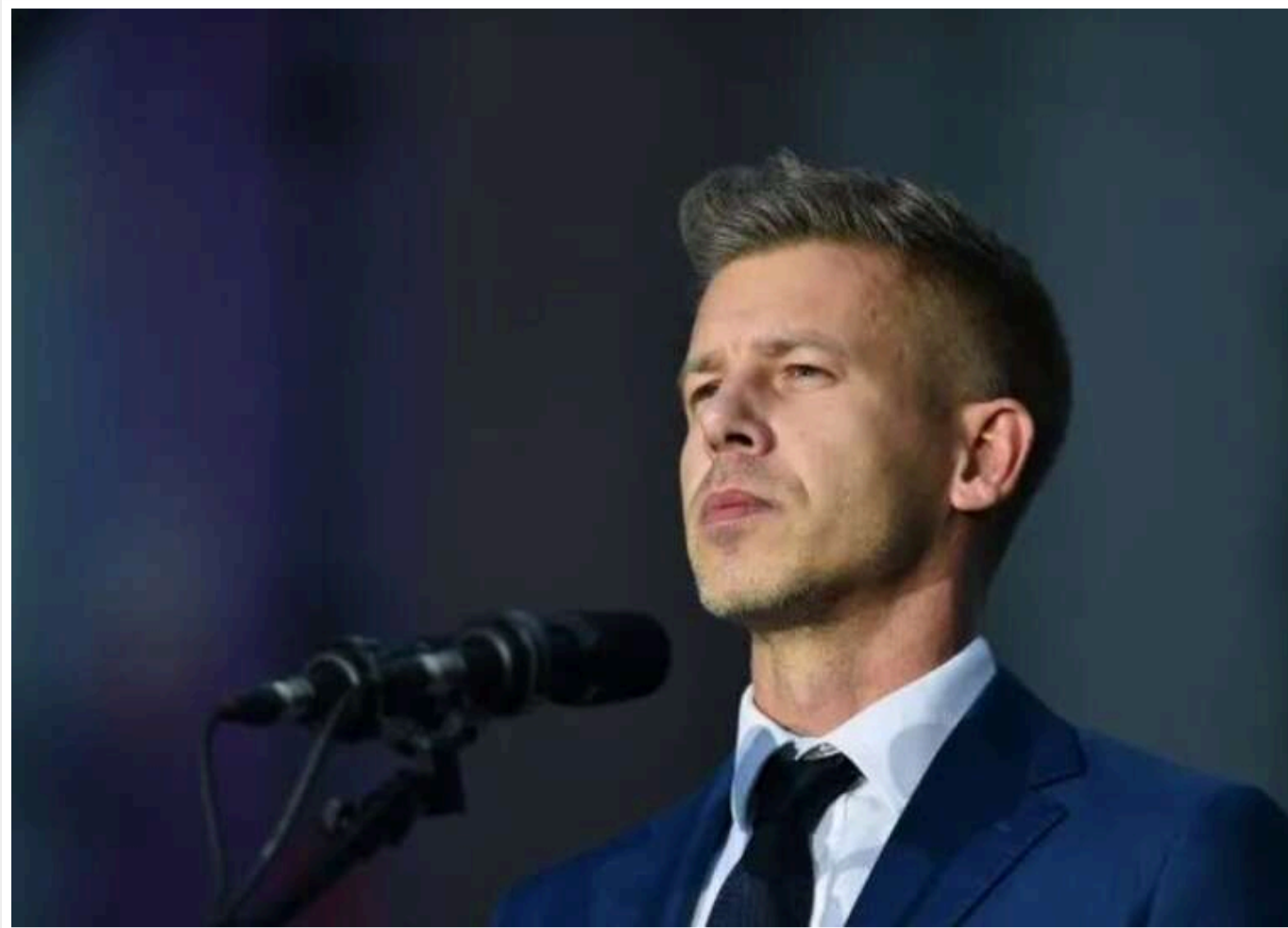
Новий прем'єр Угорщини Петер Мадяр планує розширити «Вишеградську четвірку» та повернути їй вплив у ЄС

Новий прем'єр Угорщини Петер Мадяр заявив про намір повернути "Вишеградській четвірці" вплив у ЄС та навіть розширити її новими країнами.