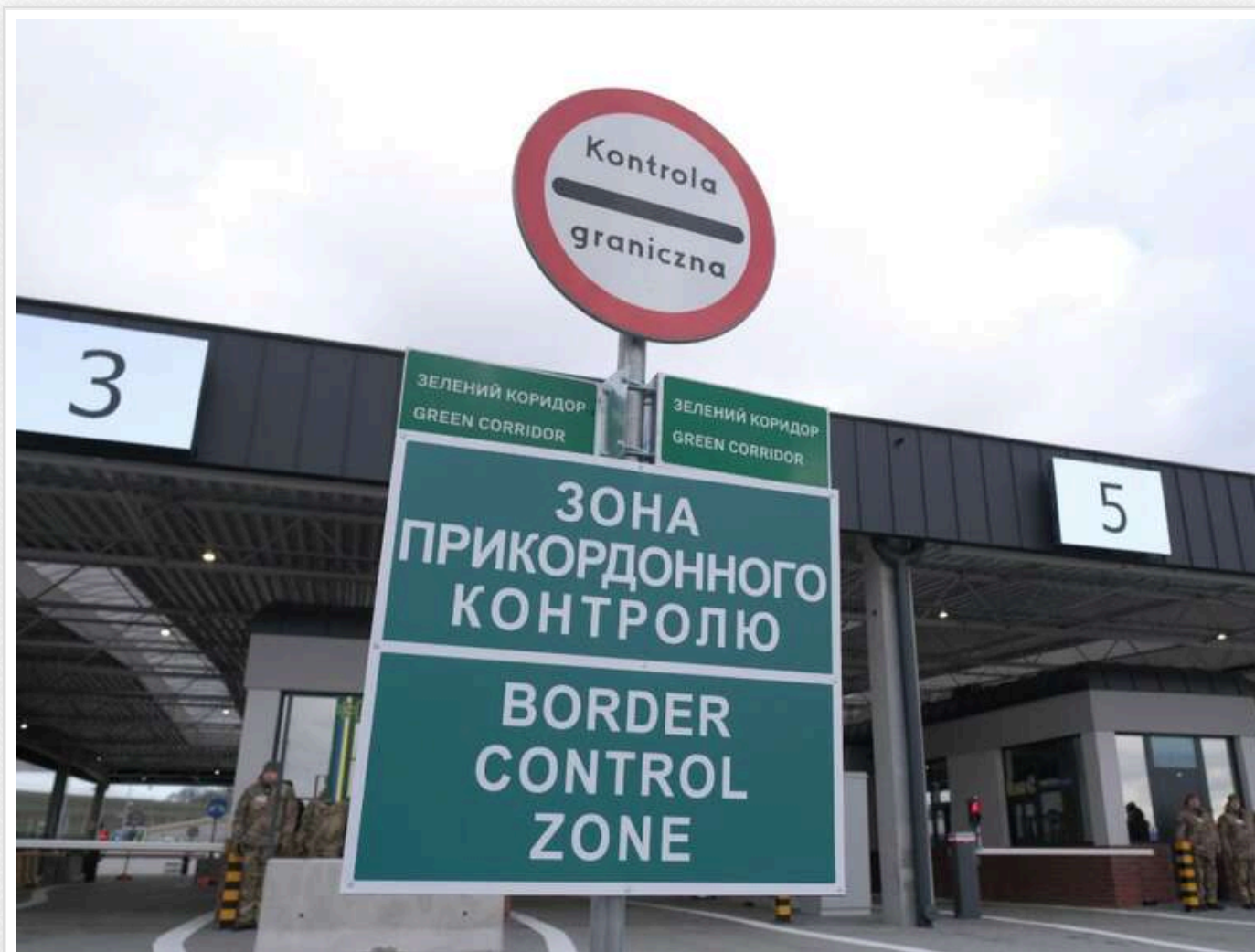
Мільйонна схема на пільговому миті: суд у Львові оштрафував ексдиректора за підробку європейських сертифікатів

12 травня 2026 року Галицький районний суд м. Львова виніс постанову у справі про масштабне ухилення від сплати митних платежів. Керівник підприємства намагався зекономити понад півтора мільйона гривень податків, підсунувши митниці підроблені європейські документи.