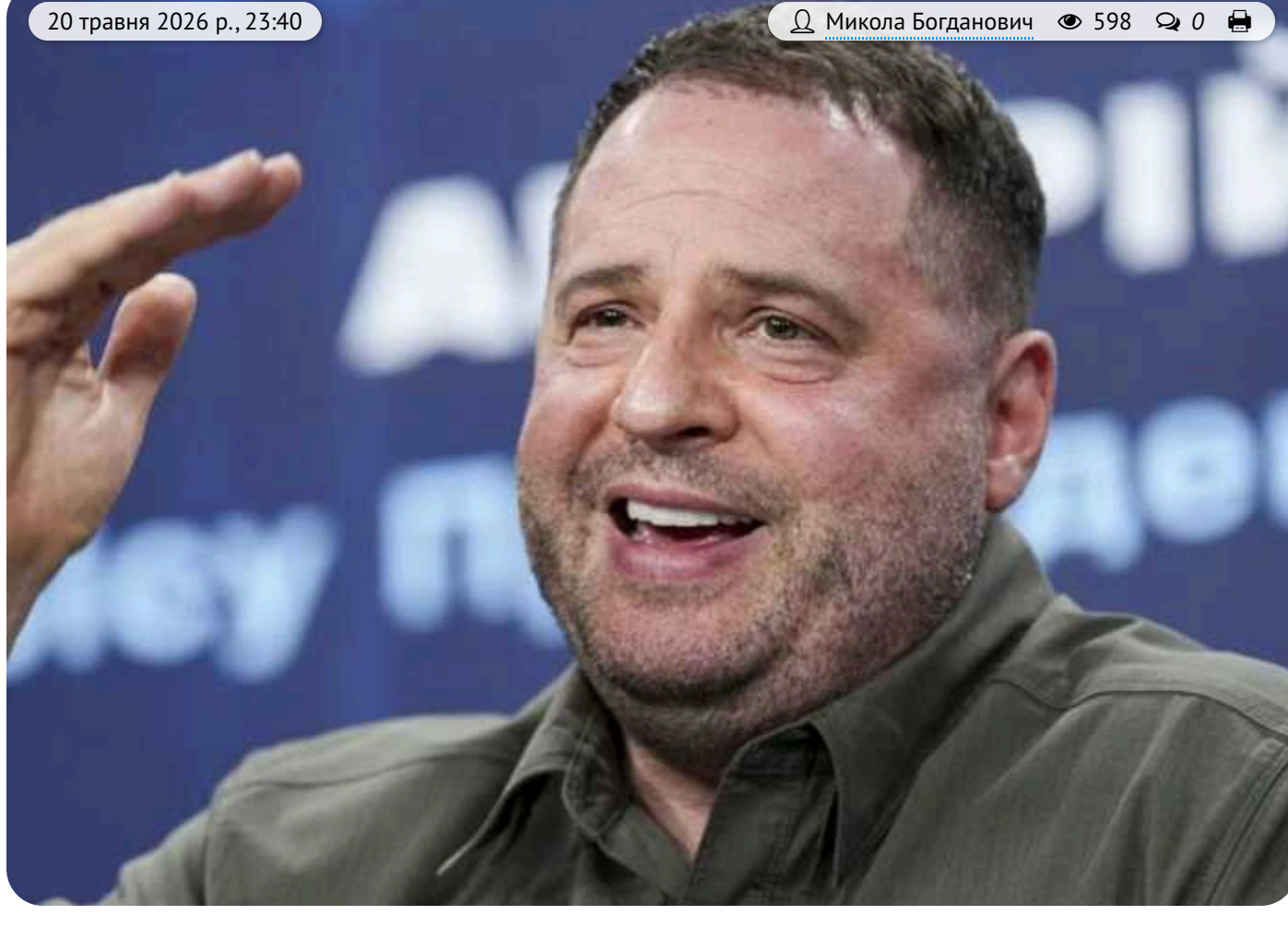
460 мільйонів «Енергоатому» та маєтки в Козині: як ексголова ОП Андрій Єрмак рятував «Династію» від конфіскації

У комунікації про підозру ексголови офісу президента Андрію Єрмаку Національне антикорупційне бюро оприлюднило документ, у якому було розписано покроковий план із виведення маєтки «Династія» з-під арешту і конфіскації. Ми переконані, що тези з цього плану варто використати для посилення національного конфіскаційного режиму, аби надалі ніхто не міг такими способами зберегти злочинно набуте майно.