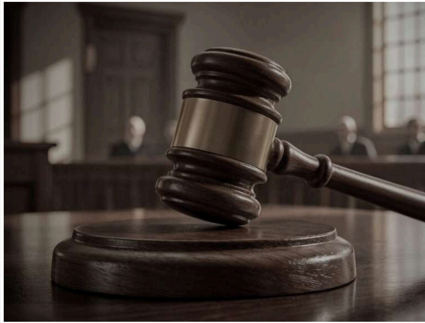
Суд оштрафував водія, який намагався вивезти до Італії приховані дрони DJI та Autel

Чернівецький районний суд міста Чернівців розглянув справу щодо водія мікроавтобуса, який намагався незаконно перемістити через кордон коштовні комплекси безпілотних літальних апаратів.