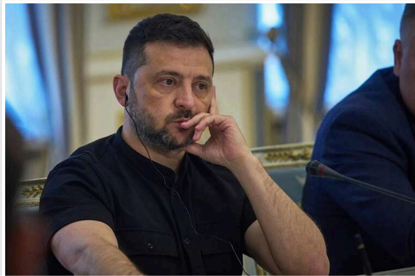
Володимир Зеленський провів зустріч із фракцією «Слуга народу» та обговорив порядок денний Ради

Президент України Володимир Зеленський у середу, 20 травня, зустрівся із керівництвом парламентської фракції "Слуга народу". Із ними, як із представниками монобільшості, Зеленський обговорив ключові питання на порядку денному Верховної Ради.