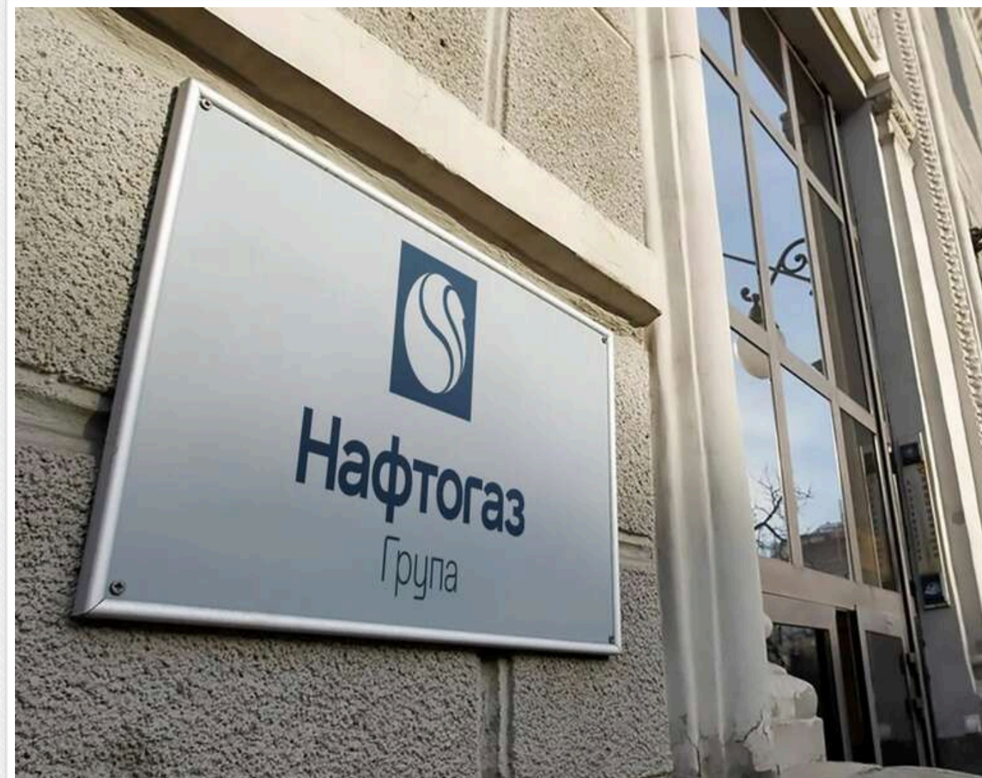
Суд у Казахстані дозволив примусово стягнути з «Газпрому» 1,4 мільярда доларів на користь «Нафтогазу»

Суд в Казахстані дозволив примусове стягнення з російського "Газпрому" $1,4 млрд на користь НАК "Нафтогаз України" за рішенням міжнародного арбітражу.