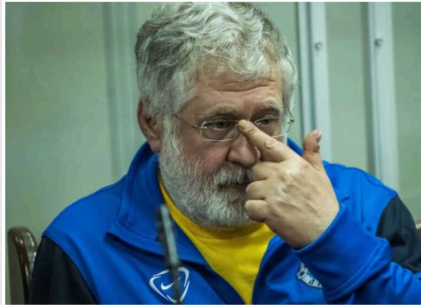
«Передати строк у спадок»: Коломойський запропонував внести відбутий тюремний термін до Цивільного кодексу