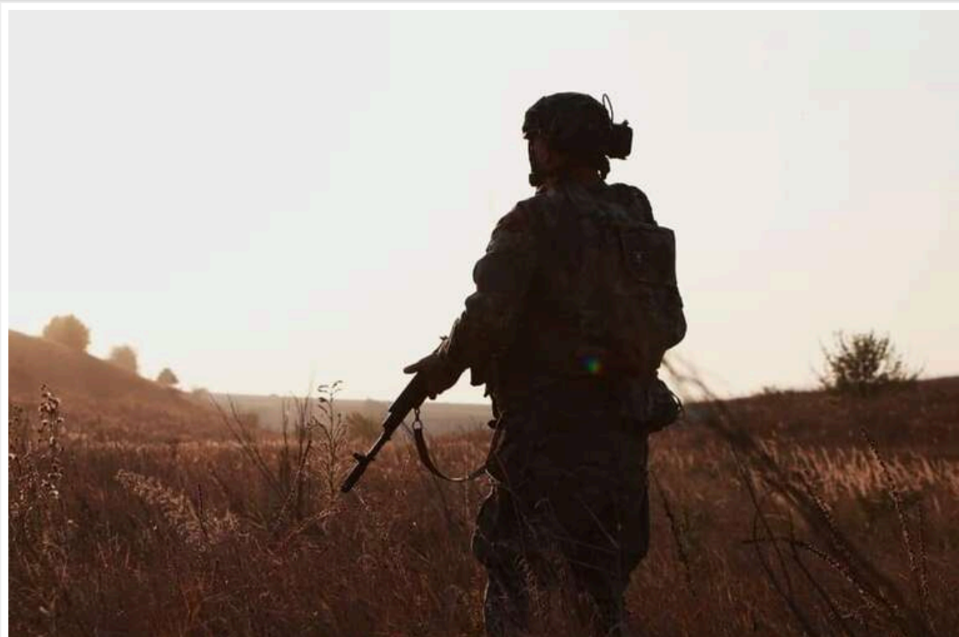
Ситуація на фронті: ворог випустив понад 200 КАБів та найактивніше тиснув на Покровському і Гуляйпільському напрямках

Від початку доби 20 травня на фронті сталося 177 бойових зіткнень.