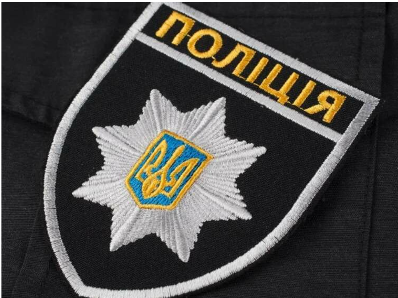
МВС звільнило водія Центру обслуговування підрозділів, який фігурує у справі про корупційну схему в поліції