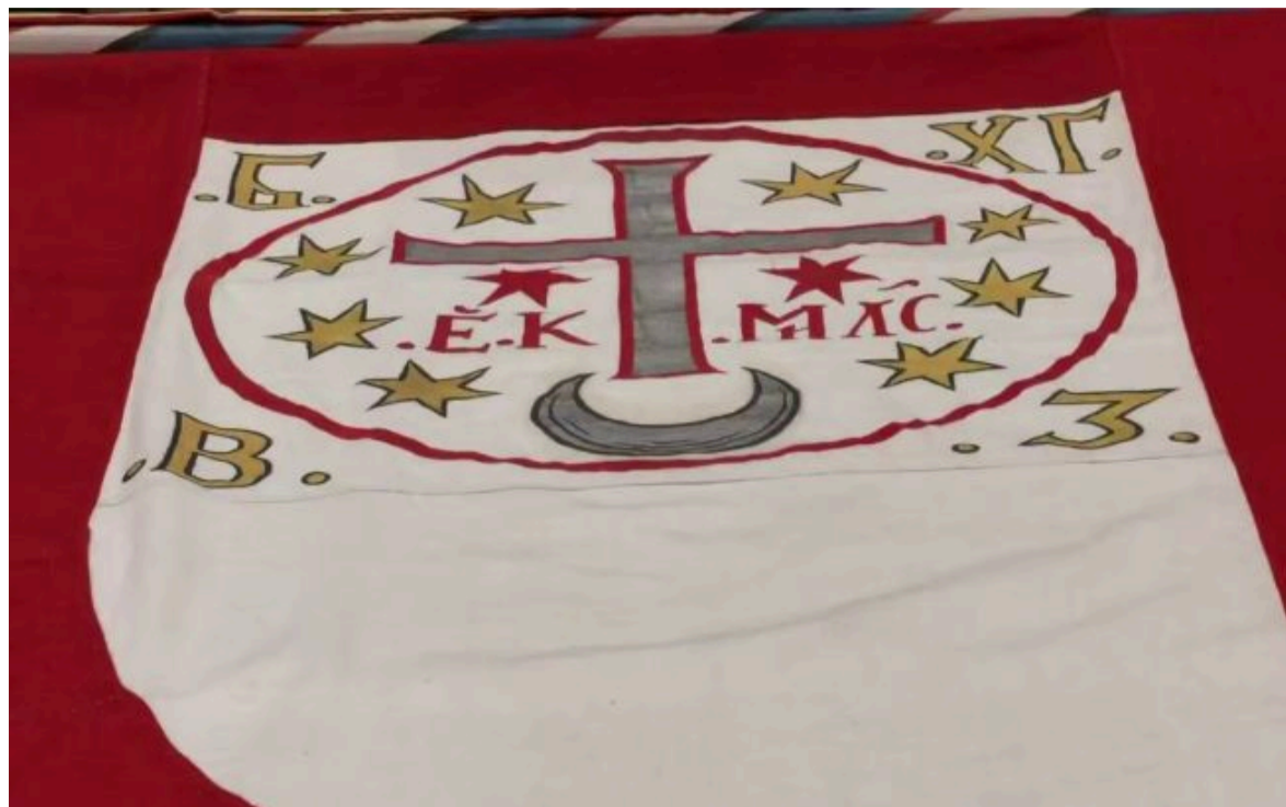
Фото: репліка бойової хоругви гетьмана Богдана Хмельницького, передана Україні Швецією (скріншот з відео)