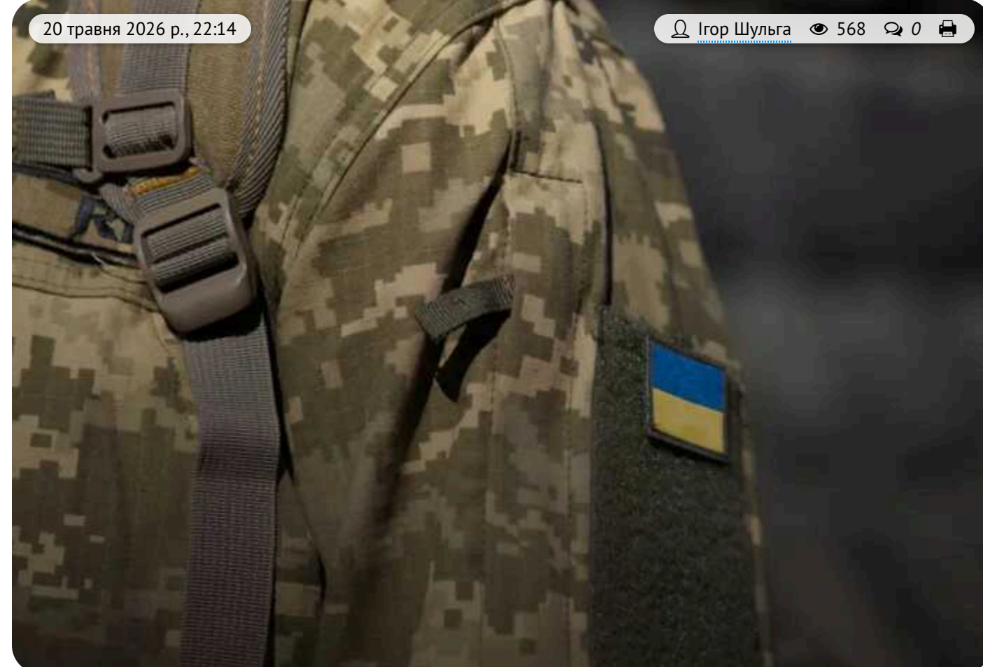
На Дніпропетровщині невідомі у військовій формі напали на рибне господарство

На Дніпропетровщині озброєні люди у військовій формі напали на рибне господарство в селі Олексіївка.