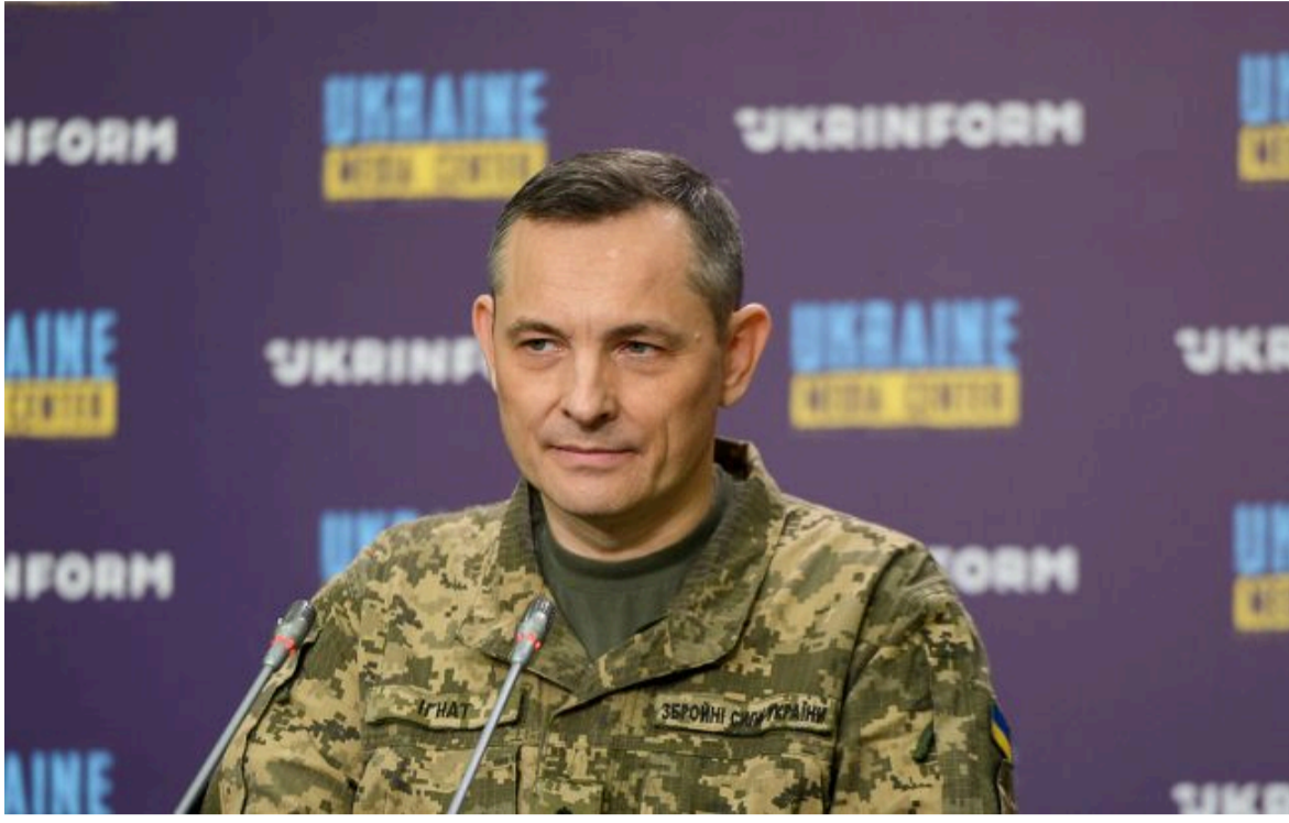
Фото: начальник управління комунікацій Повітряних сил ЗСУ Юрій Ігнат