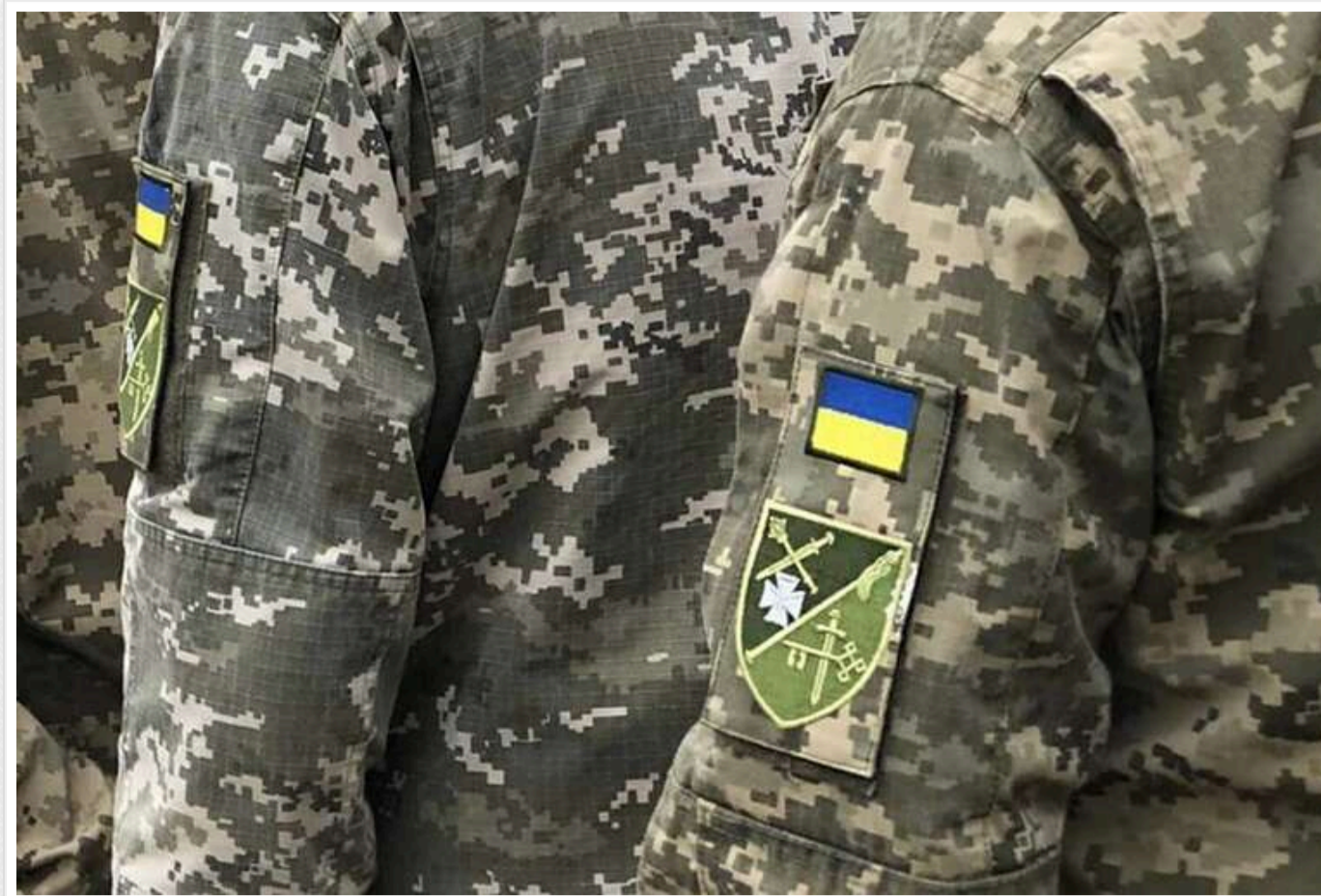
Газ у салон, розбите скло та бійка з балончиками: на Львівщині зупинка авто представниками ТЦК переросла у жорстке зіткнення