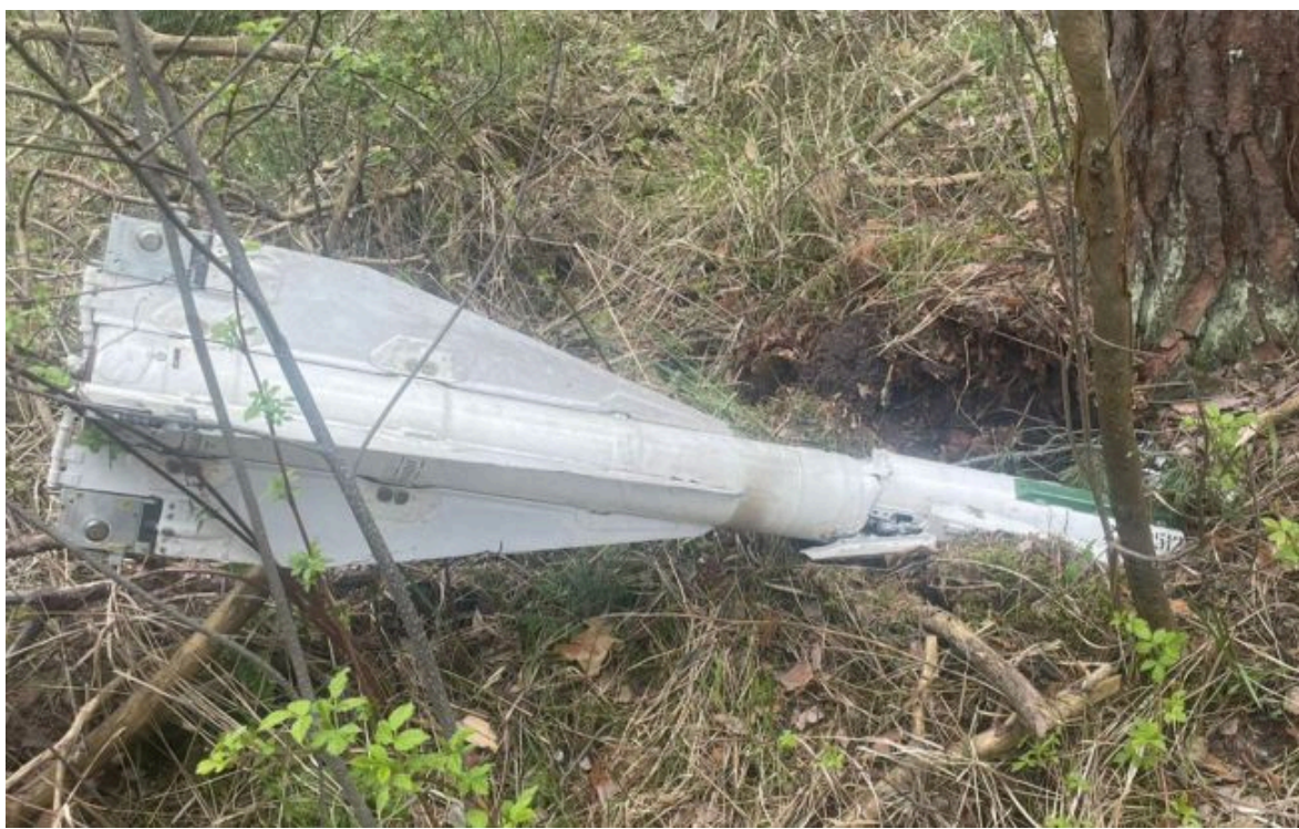
Фото: уламки дрона РФ виявили на Чернігівщині

Не витрачай час на шум! Читай тільки суть з РБК-Україна у Google