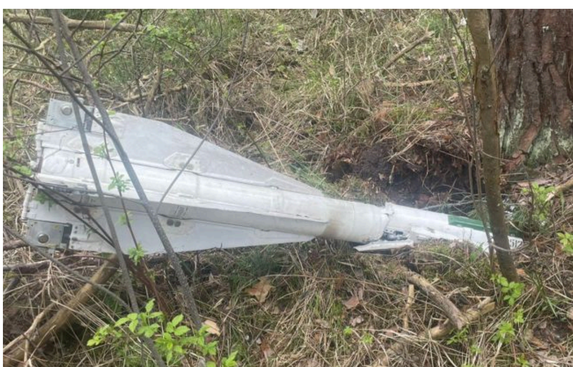
Фото: уламки дрона РФ виявили на Чернігівщині