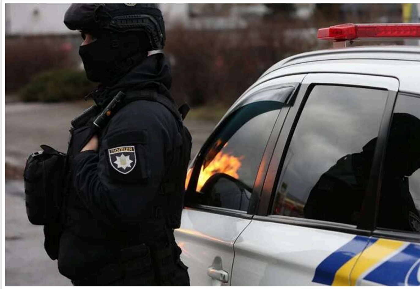
У Харківській області водій збив поліцейського під час спроби втекти від перевірки ТЦК

У Харківській області водій збив поліцейського при спробі сховатися від ТЦК.