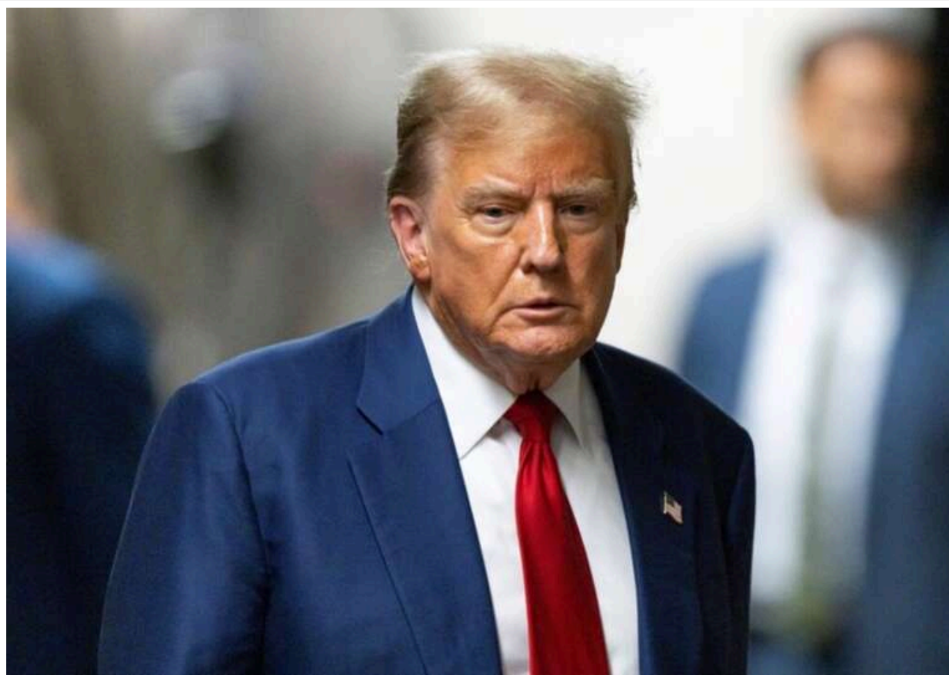
Бальний зал і шестиповерховий бункер за 400 мільйонів доларів: Трамп розкрив грандіозні плани перебудови Білого дому

Трамп повідомив, що планує не лише переобладнати східне крило Білого дому в бальний зал, але й звести під ним шестиповерховий підземний бункер.