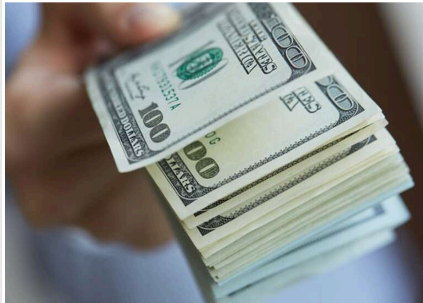
Афера на 30 мільйонів доларів: як івано-франківська компанія «Рона» кинула на гроші світового гіганта Hyundai та українські банки

Скандал навколо івано-франківської компанії «Рона» став одним із найгучніших прикладів масштабного кредитного шахрайства в Україні. За даними, які раніше оприлюднювала нардепка Галина Янченко, серед постраждалих — Hyundai Corporation, «Укрсоцбанк», інші українські банки, місцеві підприємці та мешканці Івано-Франківська. Загальна сума збитків лише банків та Hyundai перевищує 30 млн доларів.