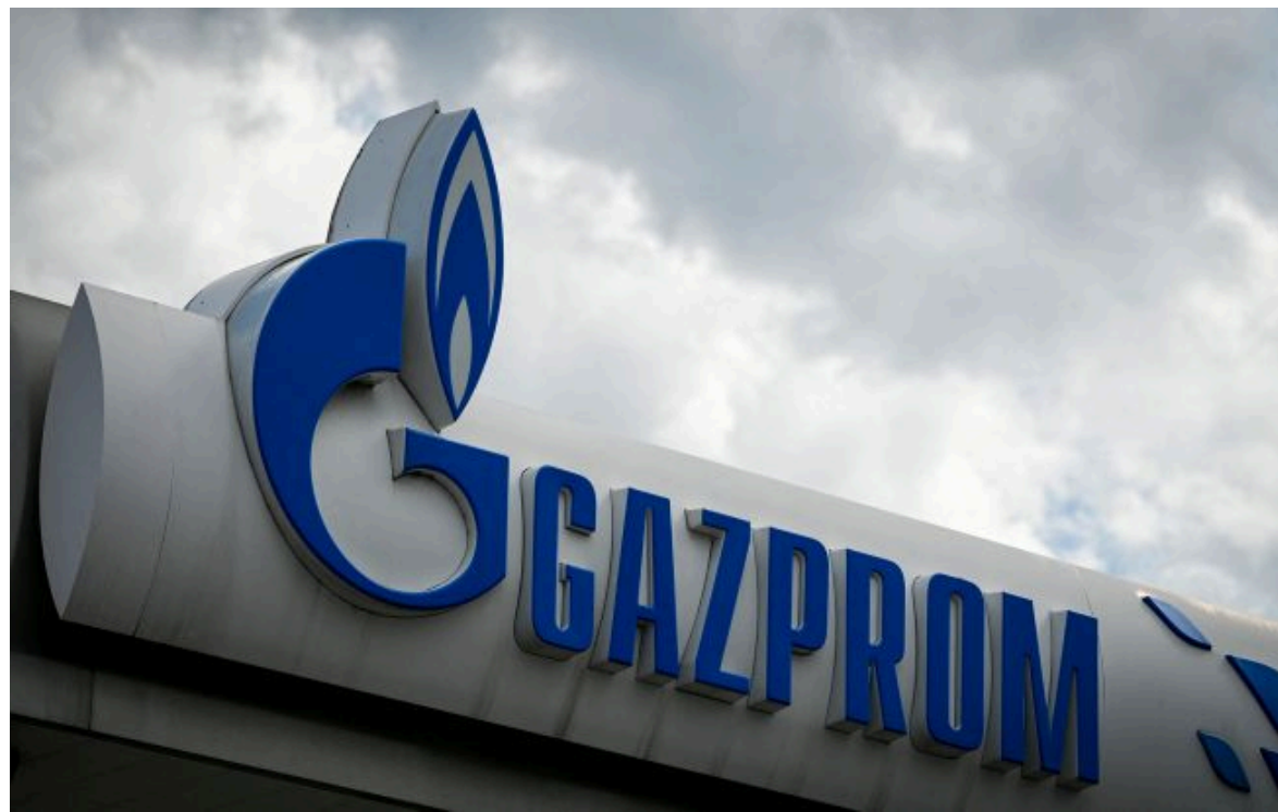
Фото: акції "Газпрому" обвалилися після візиту Путіна до Китаю