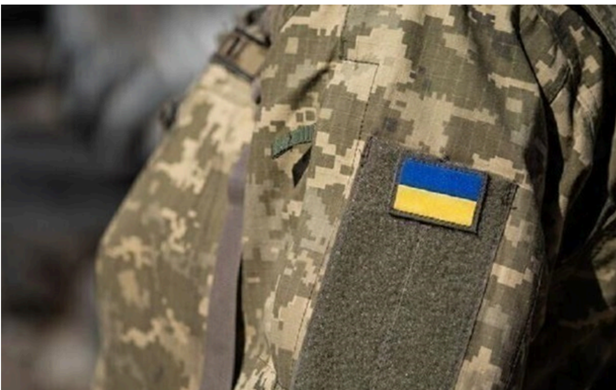
Фото: pilyuka.com (ілюстраційне фото)

Полтавський ТЦК планує ротацию військових без бойового досвіду