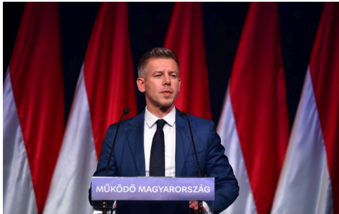
Фото: Мадяр зробив нову заяву щодо війни РФ проти України

Не витрачай час на шум! Читай тільки суть з РБК-Україна у Google