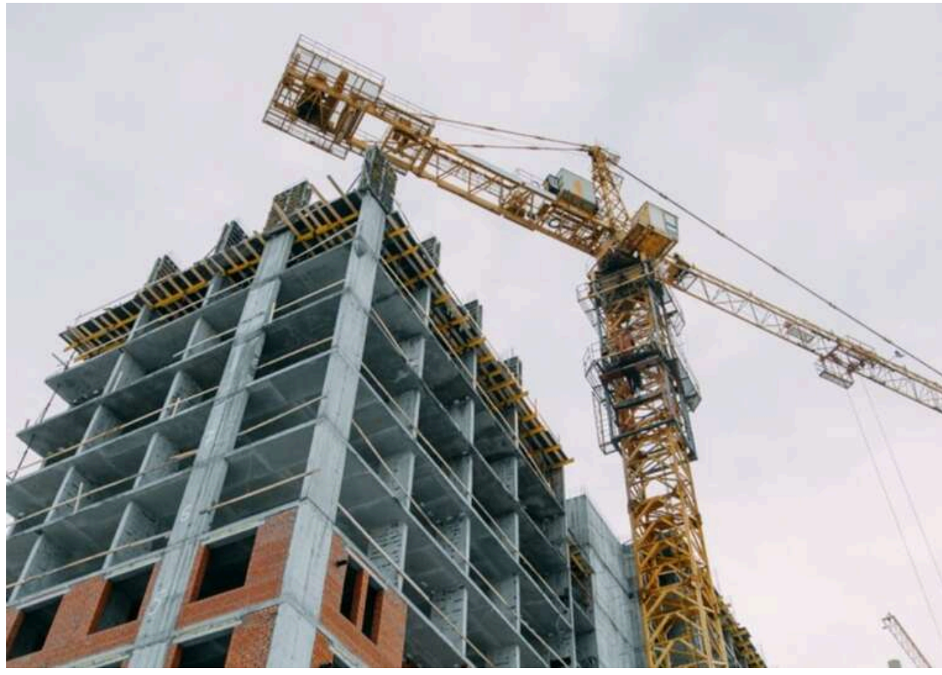
Купують повітря в котлованах: у «ЛНР» розхвалили пільгову іпотеку, але готових квартир – одиниці

З 2023 року по травень 2026 року житло за програмою пільгової іпотеки під 2% в «ЛНР» придбали 2 970 осіб.