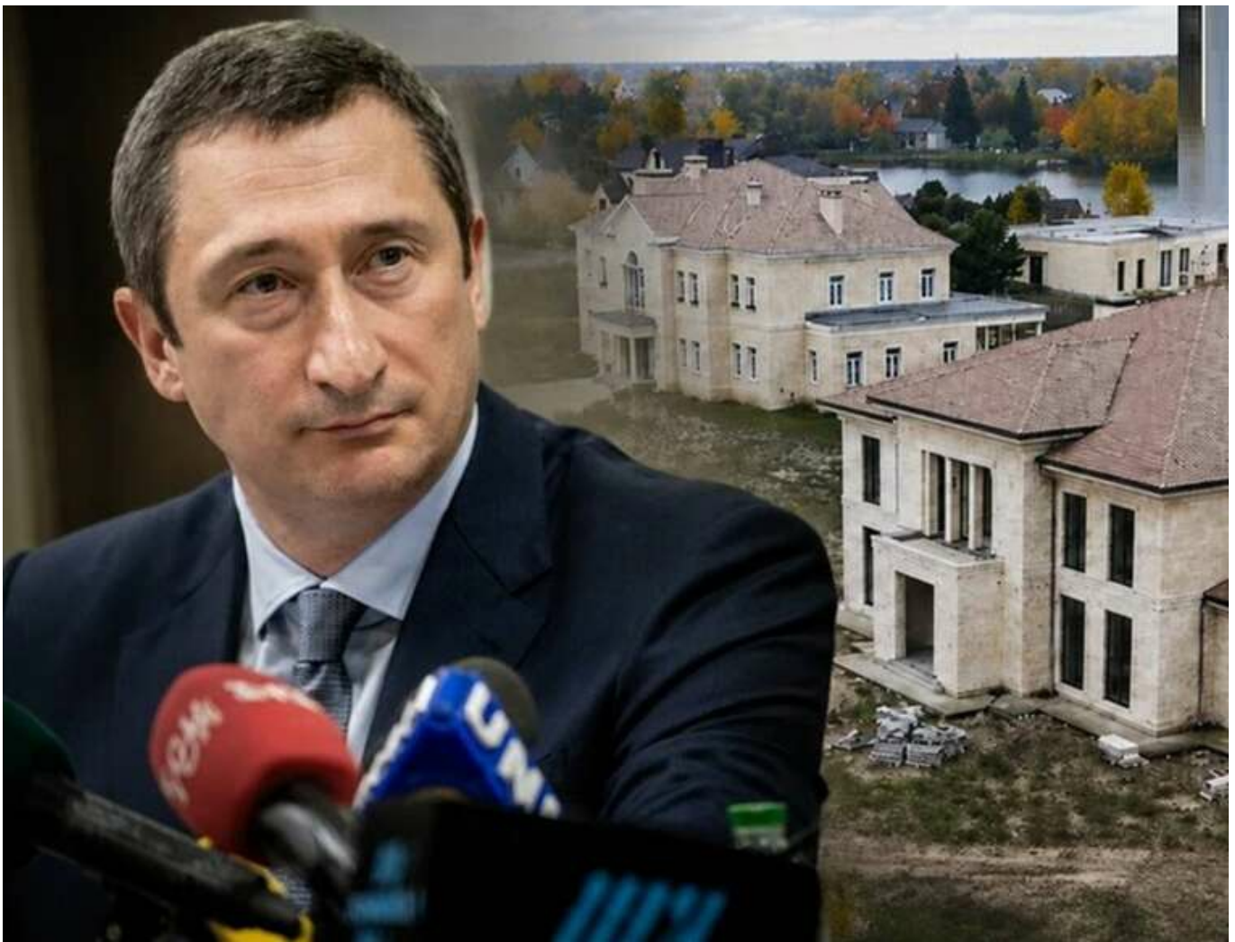
Будівництво на «цвинтарному» піску та транші від Міндіча: ВАКС розкрив нові подробиці елітної схеми «Династії» Чернишова та Єрмака

Судові хроніки будівництва котеджного містечка «Династія» у Козині остаточно перетворилися на суміш елітного детективу та готичного хорору. Поки ексвіцепрем'єр Олексій Чернишов намагається видати розслідування НАБУ за «звичні інвестиційні стосунки», матеріали справи ВАКС відкривають затишний світ Банкової з іншого боку.