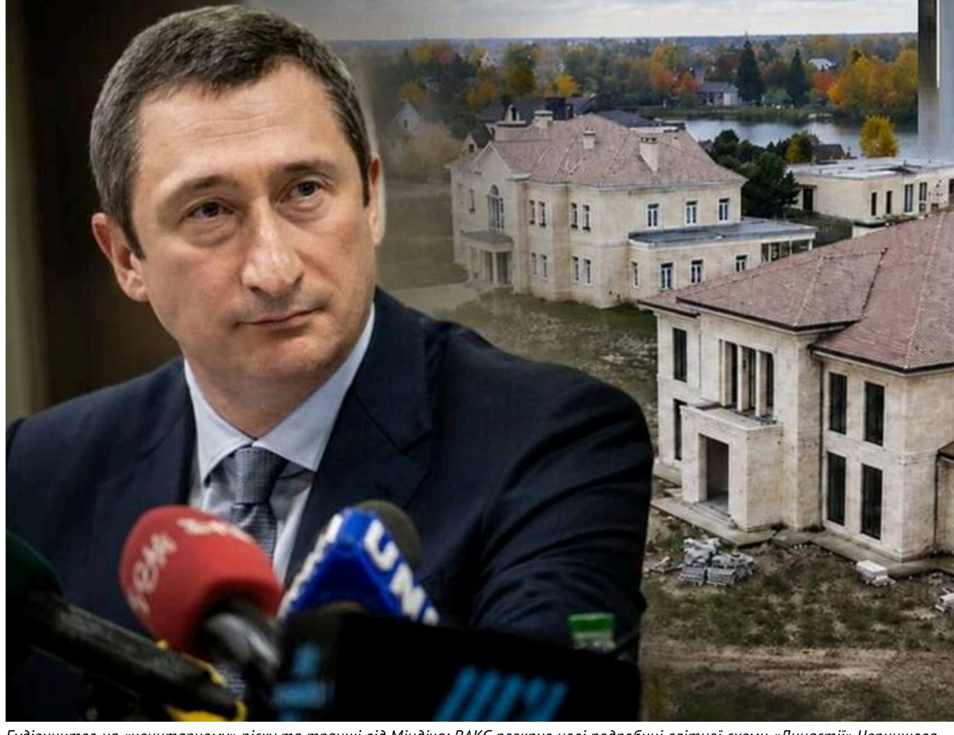
Будівництво на «цвентарному» піску та транші від Міндича: ВАКС розкрив нові подробиці елітної схеми «Династії» Чернишова та Єрмака

Судові кроки будівництва котеджного містечка «Династія» у Козині остаточно перетворилися на сумні елітного детективу та голичного хоруру. Поча ексцелпер'єр Олексій Чернишов намагається відати розслідування НАБУ за «звичні інвестиційні спосунки», матеріали справи ВАКС відкривають зашпаний світ Банкової з іншого боку.