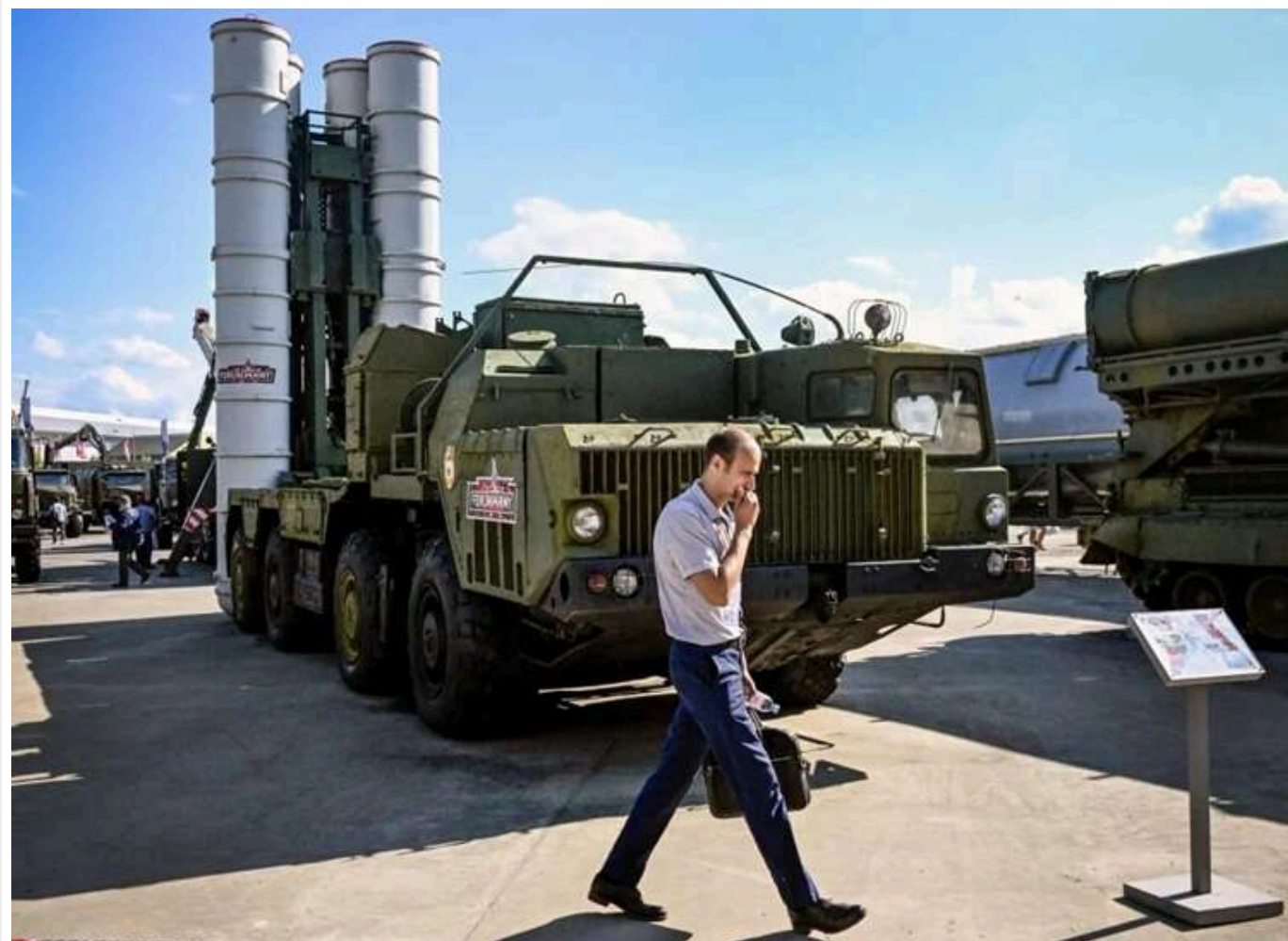
Багатомільярдний «дах» Федорова та Конотопського: Як ексдиректор із бетону очолив «Укроборонсервіс»

Новим керівником державного підприємства «Укроборонсервіс» став Євген Гвоздарьов. На цій посаді він керує багатомільярдними обладнаннями під імовірним дахом Олександра Конотопського та міністра оборони Михайла Федорова.