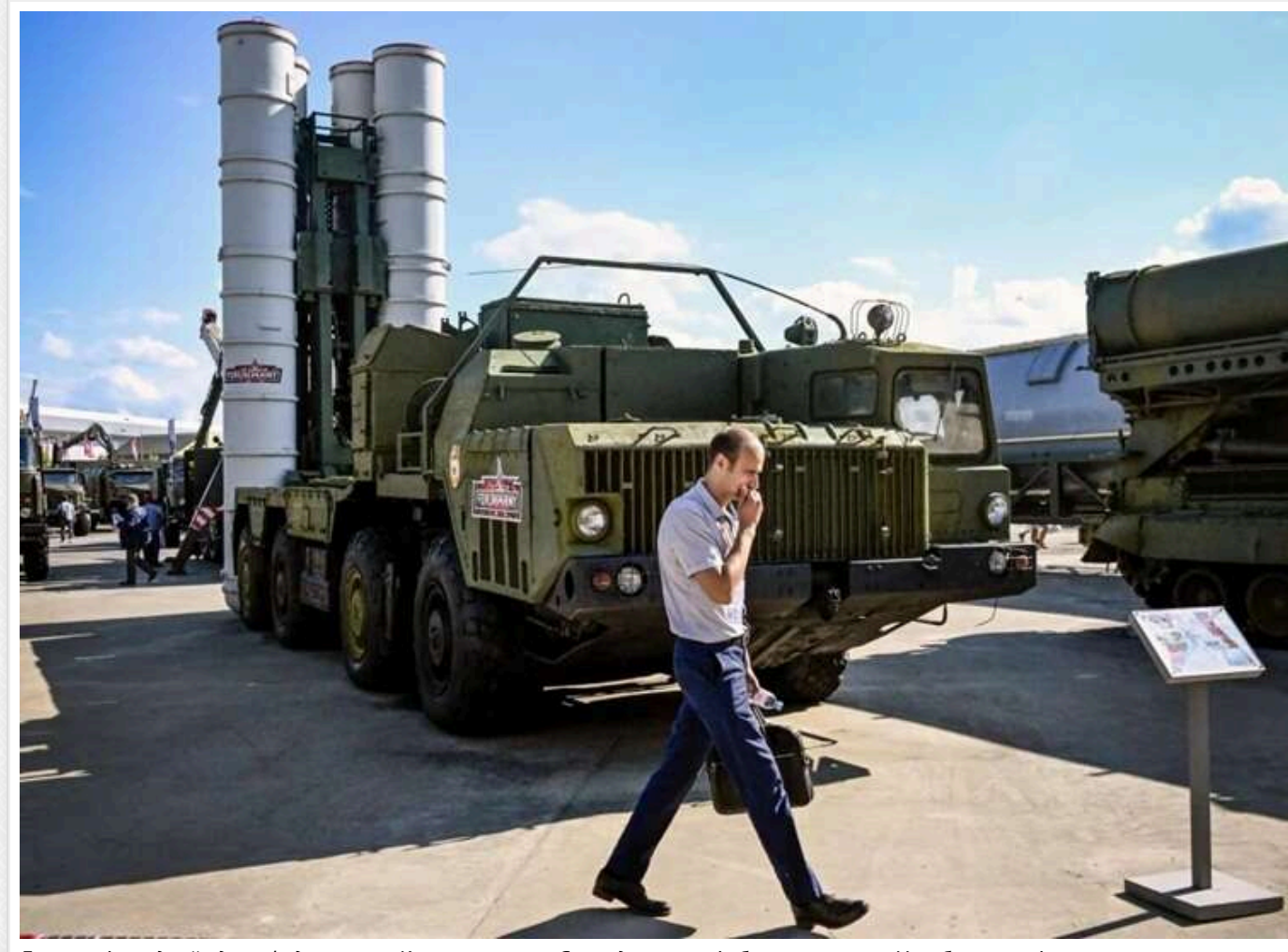
Багатомільярдний «дах» Федорова та Конотопського: Як ексдиректор із бетону очолив «Укроборонсервіс»

Новим керівником державного підприємства «Укроборонсервіс» став Євген Гвоздарьов. На цій посаді він керує багатомільярдними обладнаннями під імовірним дахом Олександра Конотопського та міністра оборони Михайла Федорова.