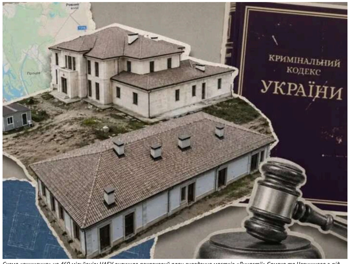
Схема «очищення» на 460 мільйонів: НАБУ вилучило покрововий план виведення маєтків «Династії» Єрмака та Чернишова з-під арешту

Свіжа аналітична довідка, вилучена детективами НАБУ в рамках операції «Мідас», продемонструвала: ексголова Офісу Президента Андрій Єрмак та ексвіцепрем'єр Олексій Чернишов зотулялися до зустрічі з антикорупційними органами значно краще, ніж країна до опалового сезону. Іхній покрововий план «очищення» котеджного містечка «Династія» вартістю 460 мільйонів зривень — це чистий візуальний кайф для поціновувачів офшорного шмття. Продати палац під виглядом безформної купи цегли, повистити іпотeku від «дружнього» банку та легалізувати все через фіктивні торги — ця схема працювала бездоганно, аж поки Брюссель не вирішив прискорити інтеграцію Директиви ЄС, яка вміє множити на нуль навіть найелегантніший козвиський феншуй.